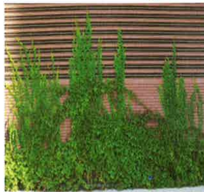
壁面緑化施工例（ツタタイル工法）