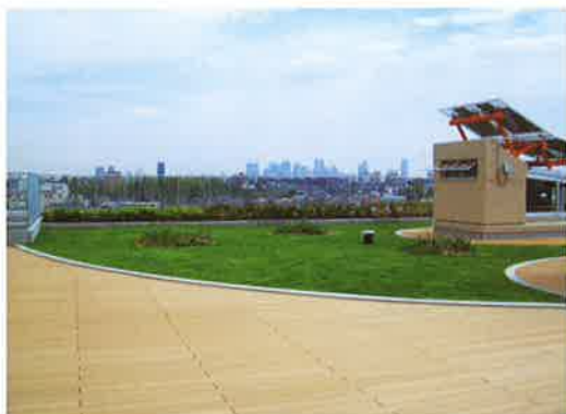
エコスクール施工例（薄層緑化+ウッドデッキ）