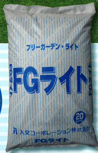
20kg / 袋